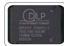
New TI chip