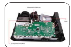
Independent Cooling System